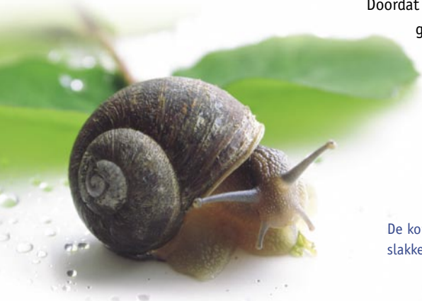
De korenwolf eet naast plantaardig voedsel ook slakken en andere insecten en kleine zoogdieren.

Doordat luzerne meerdere jaren op hetzelfde perceel groeit, kan de korenwolf in dit gewas een stabiele burcht maken.