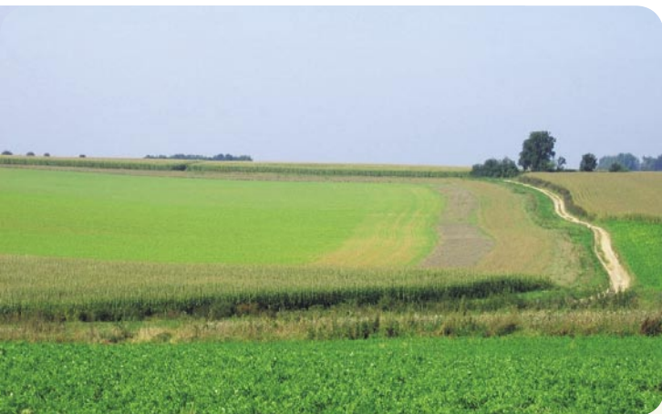
Het leefgebied van de korenwolf: het akkerland.

DLG voert het secretariaat en neemt de dagelijkse aansturing van het project op zich, zoals aankopen en beheren van gronden. Ook geven ze informatie over subsidies en dragen ze zorg voor de betaling van die subsidies. Conform het Soortbeschermingsplan is het de opzet dat ze nog drie gebieden gaan realiseren als beschermingsgebieden voor de korenwolf. “In 2006 worden in Koningsbosch en Puth korenwolven uitgezet en het plan is om in 2008 gronden in Wittem hiervoor te kunnen gebruiken. Daarover moet echter nog overleg plaatsvinden met de betrokken agrariërs en de gemeente. Maar Maastricht en Sittard waren hierin zeer welwillend, dus dat zal daar hopelijk ook helemaal in orde komen”, beëindigt de positieve Hornesch zijn relaas.