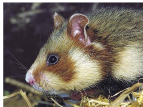
De korenwolf is onder andere herkenbaar aan de witte vlekken bij zijn hals en kop.